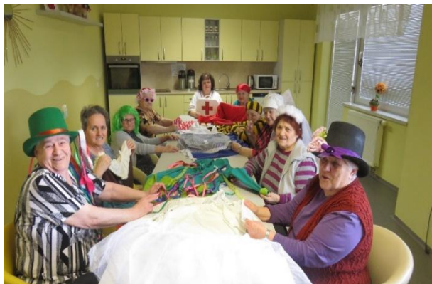
Příprava na maškarní bál