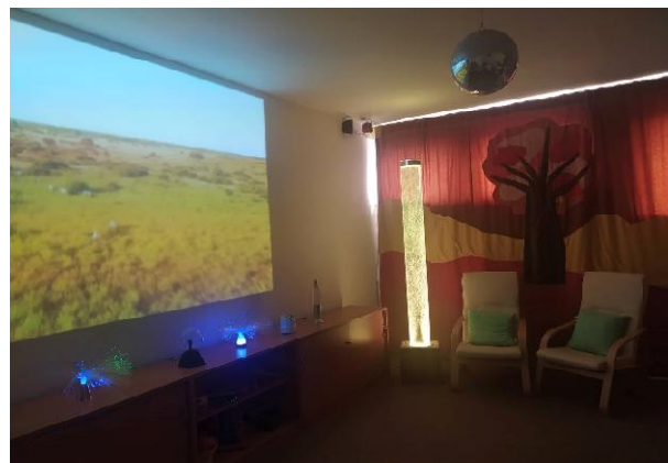
Terapeutická místnost snoezelen