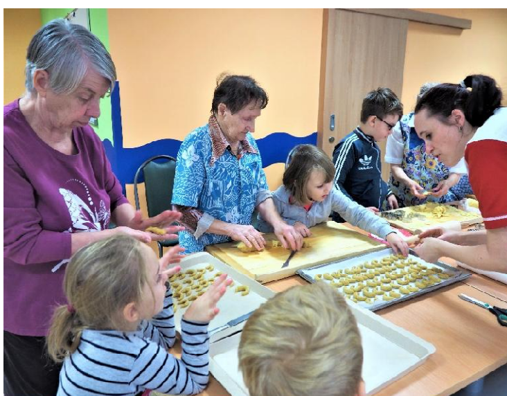
Projekt „Propojujeme generace“